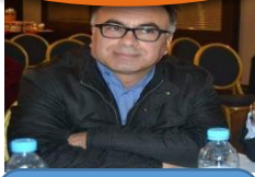
استاذ التعليم العالي بكلية الحقوق وجدة