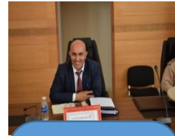
السيد عبد الباقي حسني المفتش الجهوي للتعمير واعداد التراب الوطني والهندسة المعمارية بجهة الشرق الإطار التوجيهي للسياسة العامة في مرحلة ما بعد جائحة كورونا