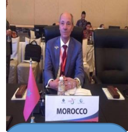
السيد عبد السلام الصديقي وزير التشغيل والشؤون الاجتماعية سابقا ماذا ينتظر من التنموي النموذج الجديد؟