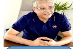
السيد ياسين زغول رئيس جامعة محمد الاول بوجدة